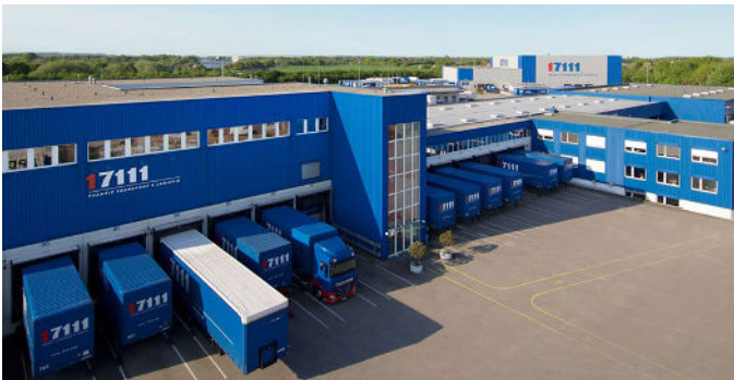
Be- und Entladung bei 17111 Logistik GmbH

Die 17111 Logistik GmbH, ein etabliertes Logistikunternehmen mit über 70 Jahren Erfahrung, steht für eine anhaltende Verpflichtung, stets an vorderster Front der Branche zu operieren. Dieses Bestreben nach ununterbrochener Verbesserung führte zur Einführung von agorum core pro als zentrales Dokumentenmanagementsystems (DMS). Der IT-Leiter von 17111 gab interessante Einblicke in den Auswahlprozess, die Herausforderungen des vorherigen Systems und die erzielten Vorteile durch die Einführung von agorum core pro .